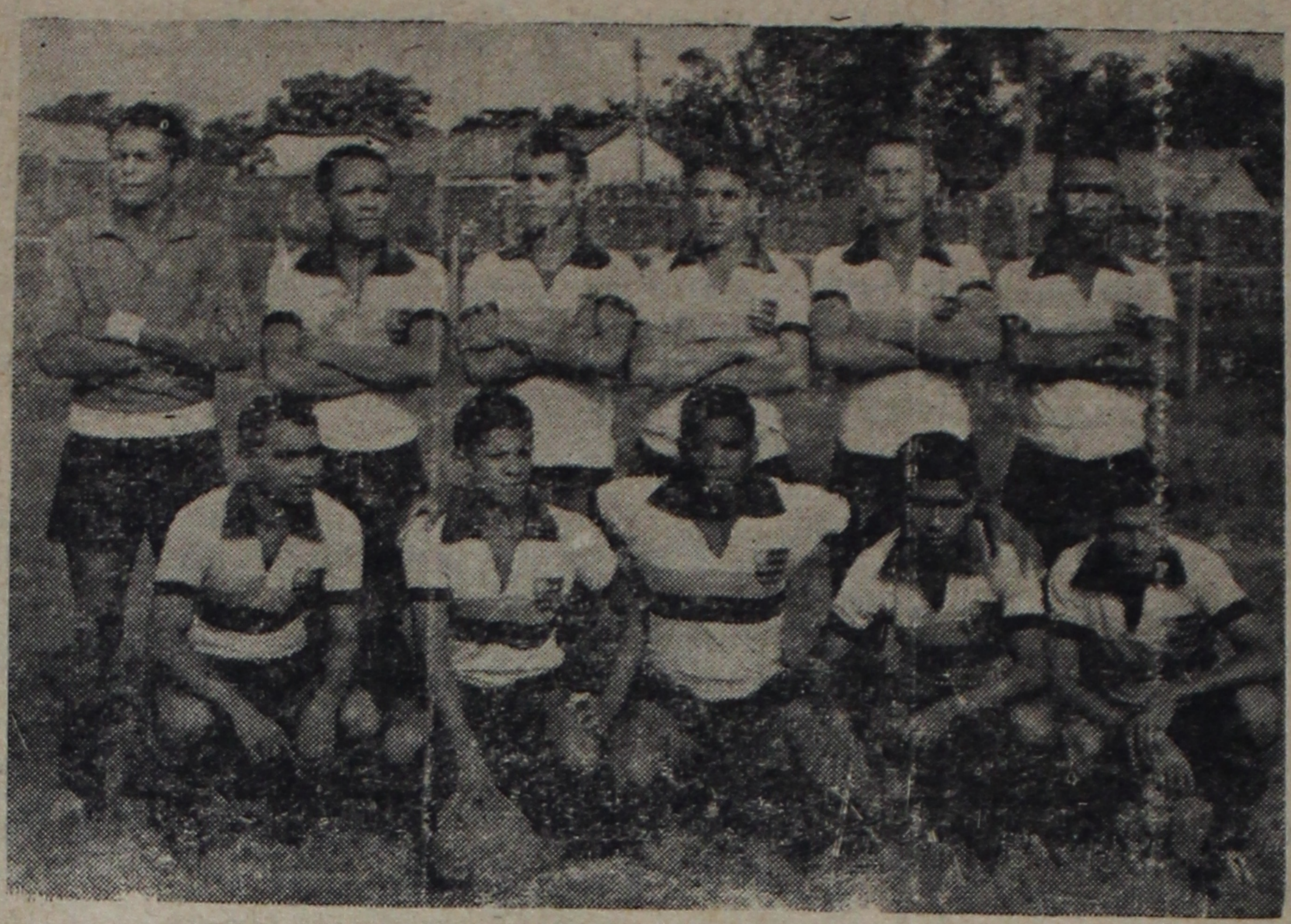
Este é o Quadro do E. C. Flamengo, que logo mais estará enfrentando o MAC, pelo Torneio Piauí — Maranhão

Dê sua contribuição para a MARCHA DA FAMÍLIA COM DEUS PELA LIBERDADE. Transporte gratuitamente as pessoas pobres, dos subúrbios, na terça-feira à tarde, a fim de que todos possam tomar parte no movimento. Com Deus pela Liberdade em defesa da Democracia.